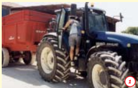
Descendre du tracteur en se tenant face aux marches

• S'informer sur les arrêtés concernant la circulation des engins agricoles