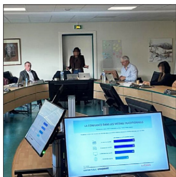
Un programme pour sensibiliser le public aux risques de suicide

Papageno est un programme de prévention du suicide créé pour sensibiliser le public aux risques de suicide et pour fournir des ressources et un soutien à ceux qui en ont besoin. Le nom « Papageno » fait référence au personnage de l'opéra La Flûte enchantée de Mozart, un oiseau qui symbolise l'espoir et la vie. Ce programme se concentre